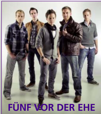
FÜNF VOR DER EHE

Neue Presse: „Fünf vor der Ehe machen's perfekt!“